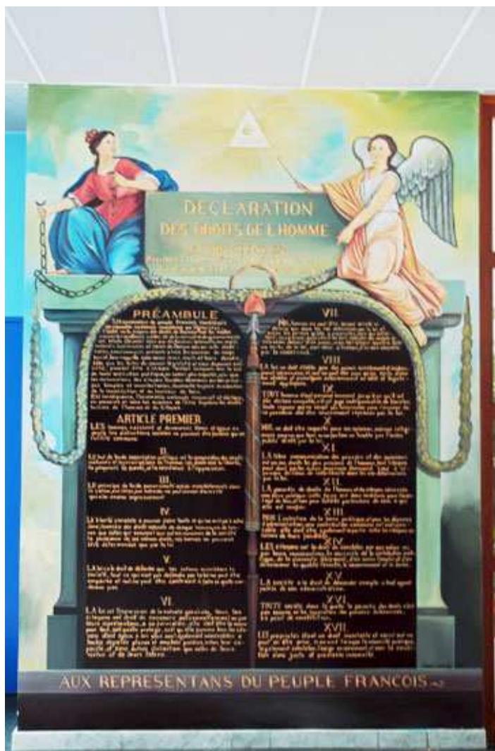
Fresque dessinée par un résident du CADA

Dans le cas d'une non obtention de papiers, la loi du 24 juillet 2006 prévoit l'Obligation de quitter le territoire. Si les demandeurs n'exercent pas un recours administratif contre cette décision dans un délai d'un mois, ils perdent tout droit de recours et pourront être placés en centres de rétention au moindre contrôle.