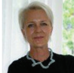
Chantal Jouanno , ministre de l'Education et de la libre circulation des id es