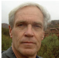
David Servan-Schreiber , ministre de la Santé et du principe de précaution