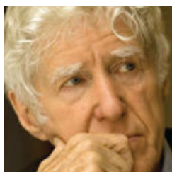
Gunter Pauli , ministre de la Recherche et de l'innovation