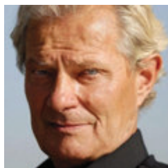
Jean-Marc Borello , ministre de l'Entreprenariat