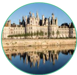
DOMAINE NATIONAL DE CHAMBORD