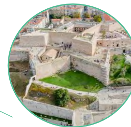
LA CITADELLE DE MARSEILLE