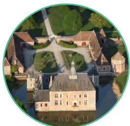
CHÂTEAU DE LA MORINIÈRE, MUR DE SOLOGNE