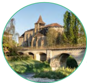
ABBAYE DE ST SEVER DE RUSTAN