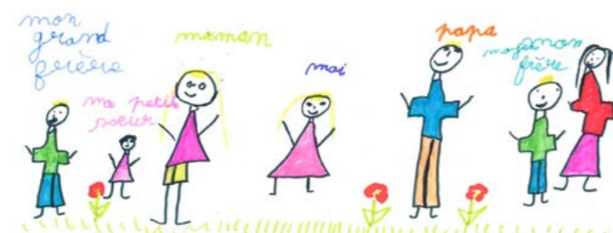
Dessin réalisé par un jeune accueilli au sein de l'Accueil éducatif en milieu ouvert 77